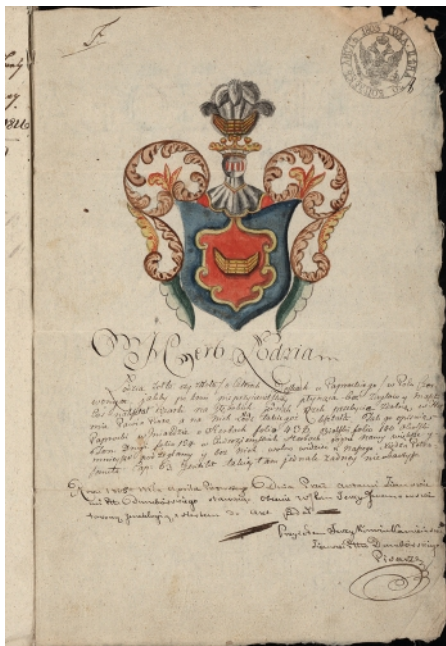
Герб Лодзя (РГИА, ф. 1343, оп. 22, д. 2660, л. 8).