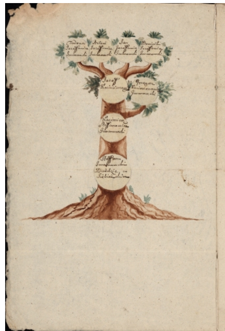
Родовое древо Ивановских герба Лодзя (РГИА, ф. 1343, оп. 22, д. 2660, л. 8 об.).