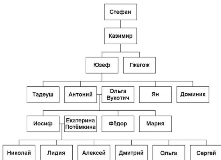
Дендрограмма рода Ивановских.