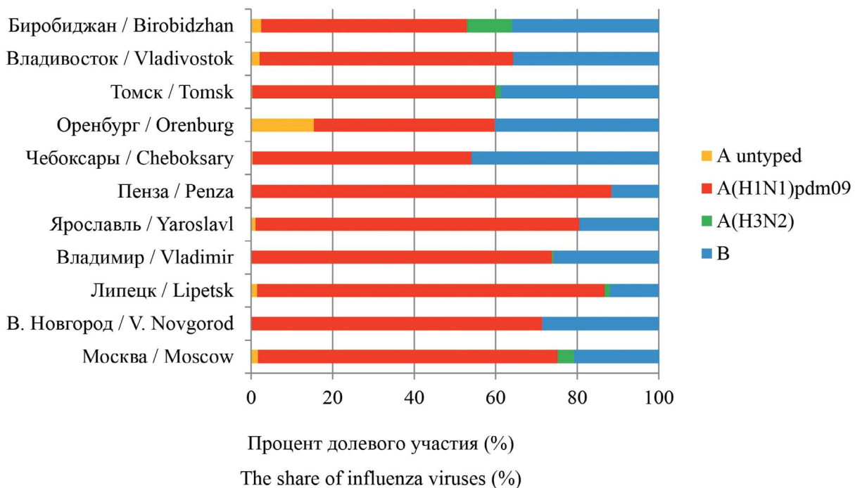
Рис. 2. Долевое участие вирусов гриппа в период эпидемического сезона 2022–2023 гг. в разных регионах РФ (по данным центров гигиены и эпидемиологии городов, областей, республик).