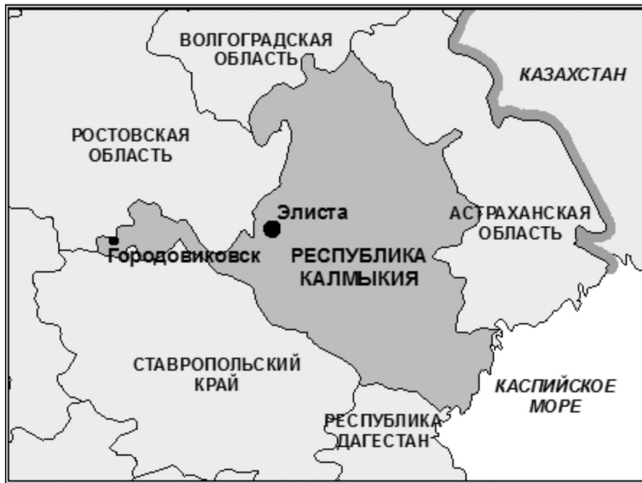
Географическое положение Республики Калмыкия